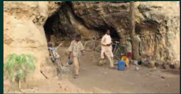
Promotion de tourisme au Mali : L'APTМ tient bon