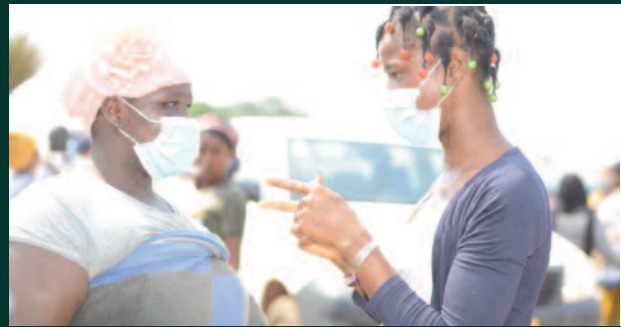
Lutte contre la COVID-19 : L'insouciance de la population