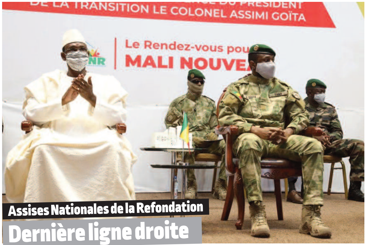
Assises Nationales de la Refondation Dernière ligne droite

QUOTIDIEN D'INFORMATION ET DE COMMUNICATION