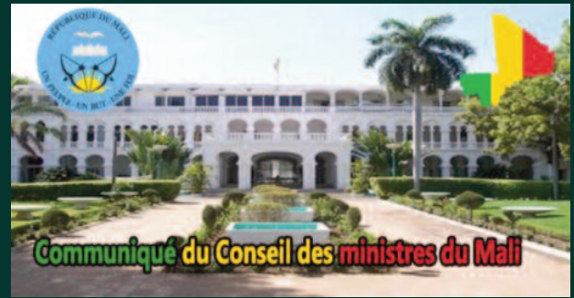
Communiqué du Conseil des Ministres du mercredi 29 decembre 2021