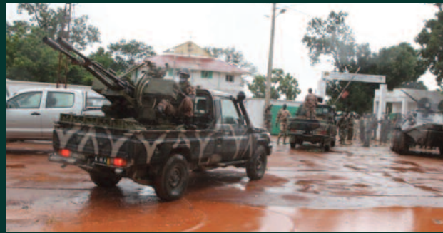
Défense et sécurité : Des propositions fortes pour la renaissance de l'Armée malienne