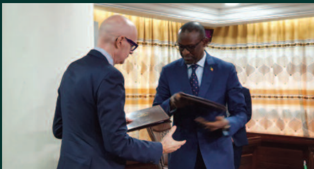
Résilience et développement durable au centre du Mali : L'U.E. au chevet du Mali