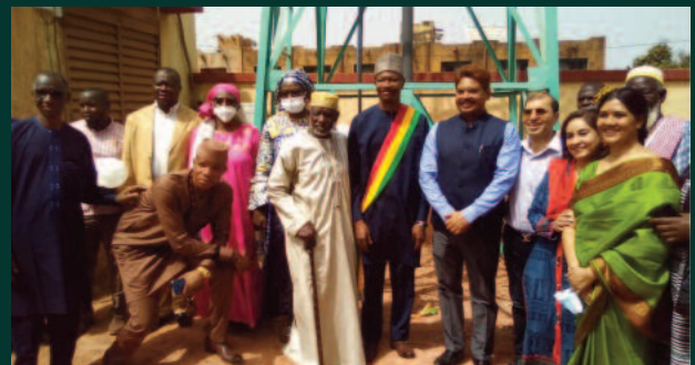
Commune VI : Un nouveau château d'eau pour le Centre de Santé de Référence