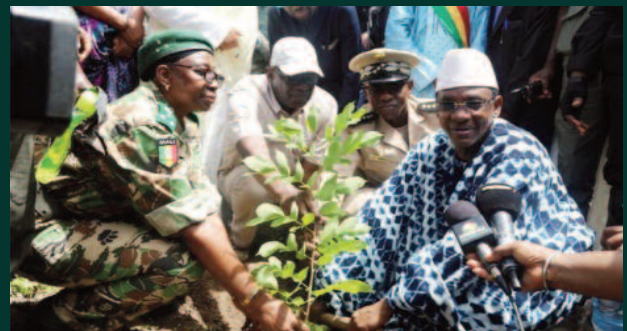
Campagne nationale de reboisement 2022 : Le premier ministre plante son arbre à tabou