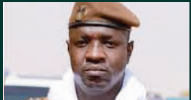
Le Colonel Modibo Koné : Un pilier de la sécurité nationale au Mali