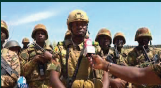
Succès de l'Opération Maliko : Le GTI-Scorpion neutralise une attaque terroriste à Ber

Un obstacle à la démocratie et à la stabilité