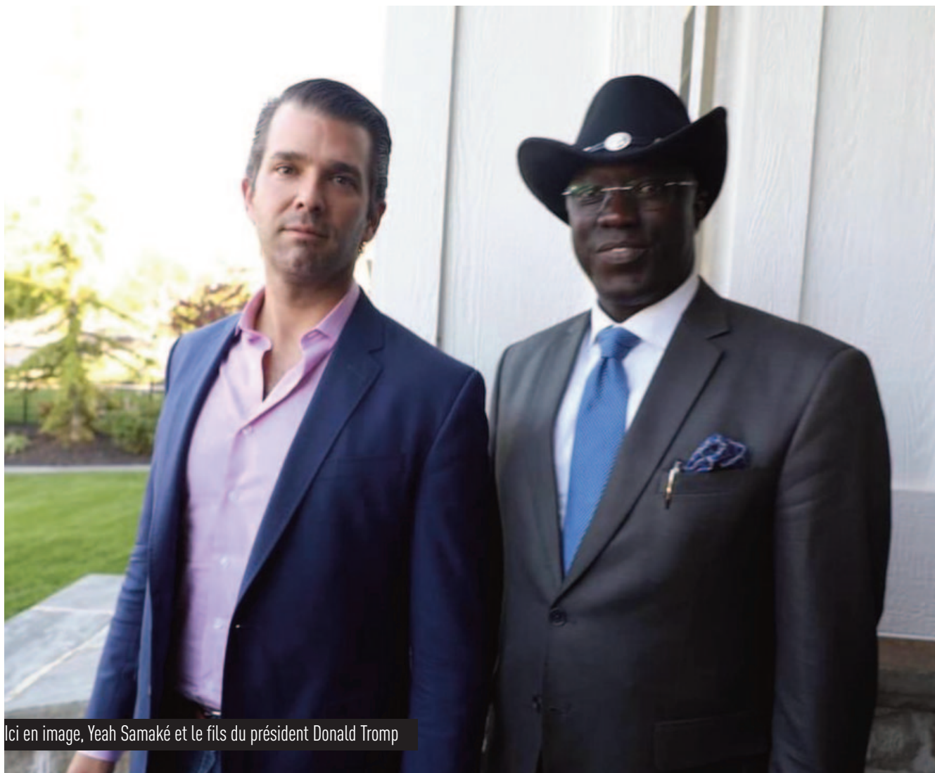
Ici en image, Yeah Samaké et le fils du président Donald Trump