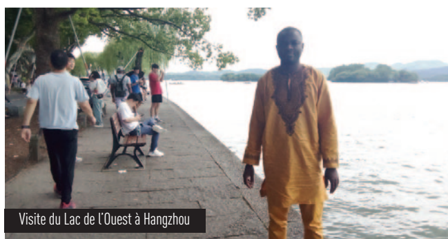
Visite du Lac de l'Ouest à Hangzhou