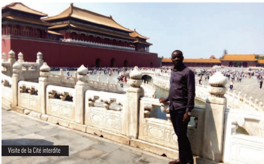
Visite de la Cité interdite