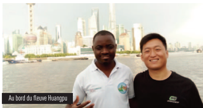
Au bord du fleuve Huangpu