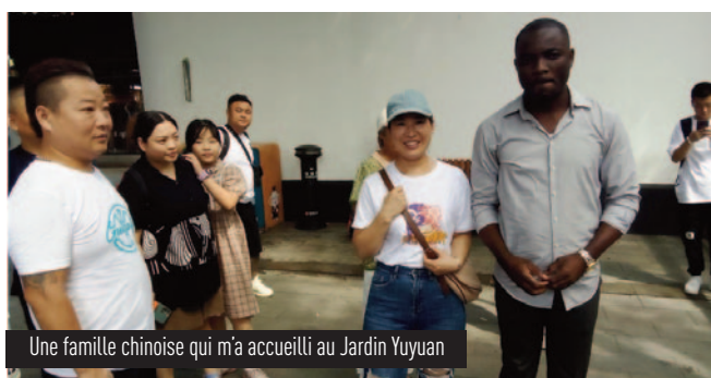
Une famille chinoise qui m'a accueilli au Jardin Yuyuan