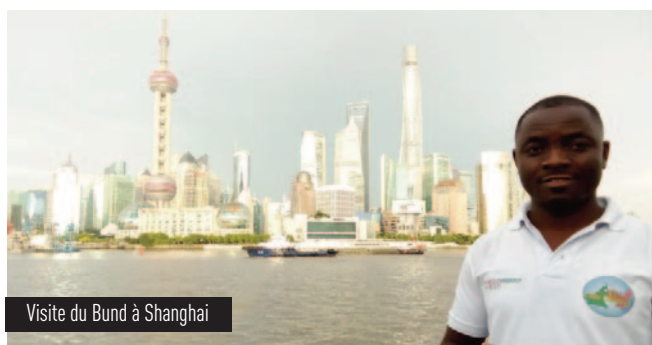
Visite du Bund à Shanghai