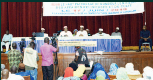
Campagne du Hadj 2019 : Top départ pour la formation des pèlerins