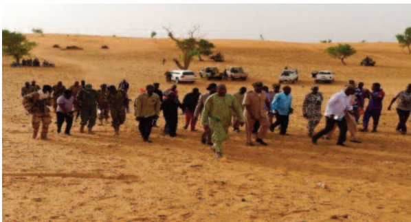
Arrivée du gouverneur accompagné du maire de sangha

Vers 17H, le gouverneur est arrivé avec sa délégation (gendarmerie, sapeurs-pompiers) etc. pour constater les dégâts et morts afin d'autoriser à les inhumés. Les 35 corps ont été inhumés dans quatre fosses communes.