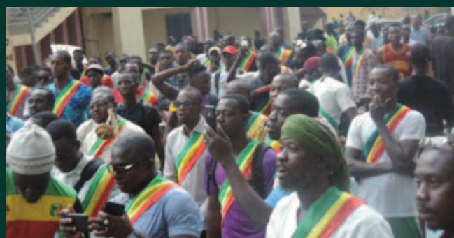
P.P.P : "Les nouveaux députés du Mali"