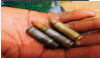
Douilles des balles utilisées.

Le dimanche 9 Juin 2019, aux environs de 17 heures TU, 12 hommes lourdement armés sur 6 motos, ont lancé une attaque surprise à partir du sud du village, suivi de 8 autres motos sur lesquelles se trouvaient 16 personnes aussi lourdement armés que les premiers. Ils encerclèrent ainsi le village et commencèrent à tirer sur tout ce qui bougeaient sans distinction (hommes, femmes enceintes, vieillards et enfants) etc.