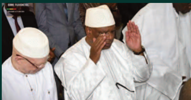
Prière nationale pour la paix : Invoquer et solliciter l'aide de Dieu sur la situation générale au Mali