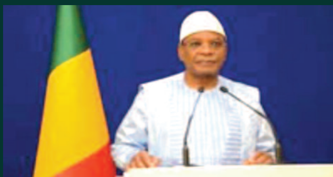
IBK s'adresse aux maliens : Entre vacuité et contradictions

Le gouvernement maintient les législatives au mépris de la vie et la sécurité des candidats et des électeurs