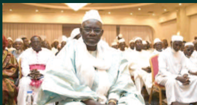
Coronavirus et fermeture des mosquées : Le nïet du HCIM