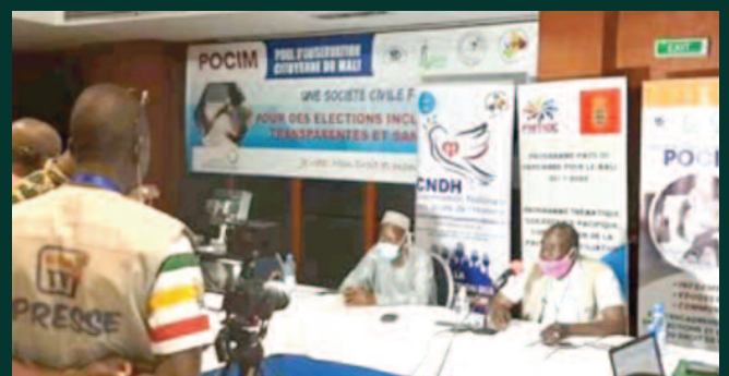
2ème tour des élections législatives : La POCIM a fait une déclaration préliminaire