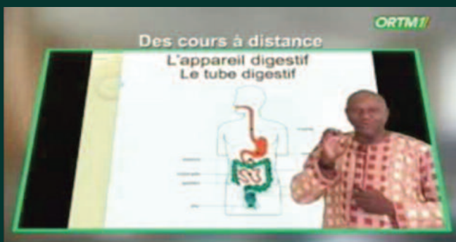
Télé-enseignement : Les prémices d'examens bâclés !