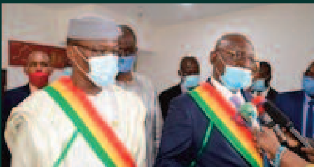
De Issaka Sidibé à Moussa Timbiné : L'Assemblée nationale en détresse