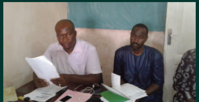
Covid-19 : L'association Siguidaw Yelen offre 1080 bavettes à une dizaine de marchés