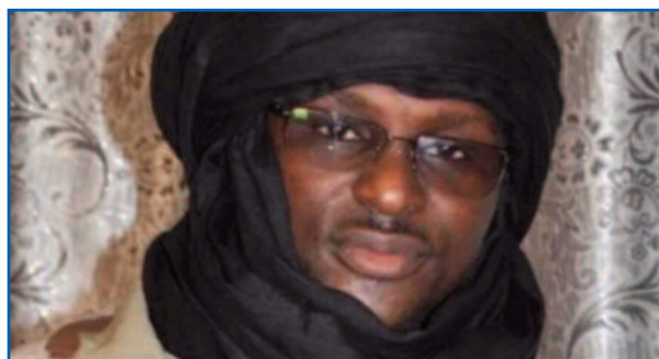
Figure de l'opposition à Alpha Condé, renversé le 5 septembre dernier, le chef de l'UFGD a apporté son soutien à la junte militaire et envisage déjà d'être candidat à la présidentielle qui devrait être organisée à la fin de la transition. Il s'est confié à « Jeune Afrique ».

Nommé le 14 octobre à la tête des renseignements généraux par Mahamat Idriss Déby Itno, l'ex-rebelle et préfet a fait un retour remarqué sur le devant de la scène tchadienne. Portrait du « père de la brousse », chef peul aux multiples vies.