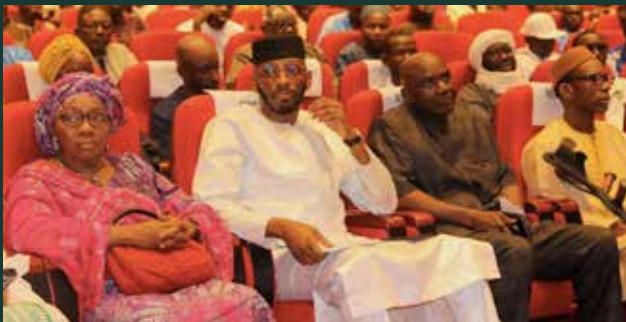
FIS : La 7ème édition remportée