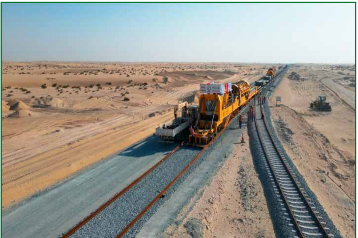
[Projet du réseau ferroviaire fédéral des Émirats arabes unis]

Après avoir parcouru les chantiers de l'ICR à travers le monde, le documentaire s'attarde sur des Afri-