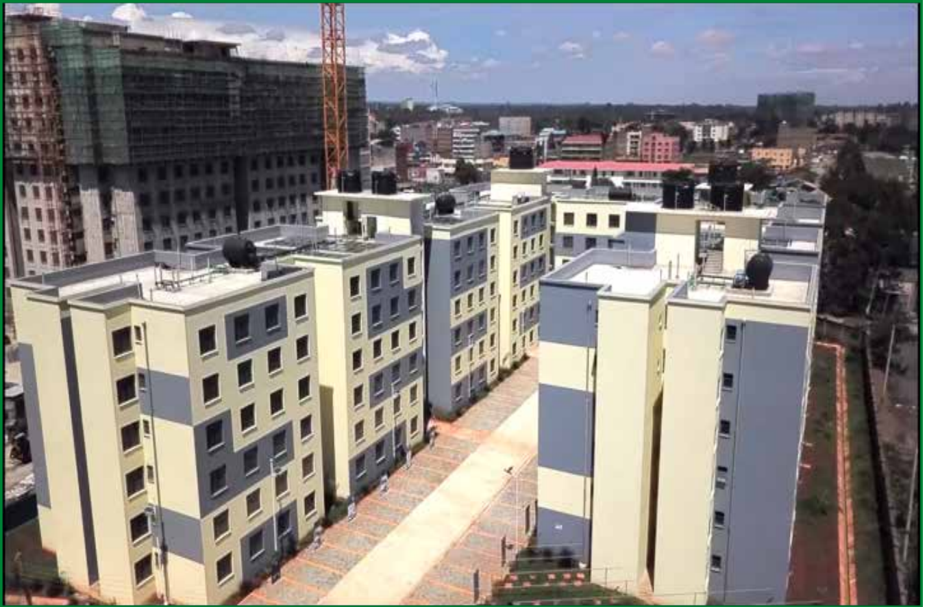
(Projet de logements abordables au Park road à Nairobi au Kenya)