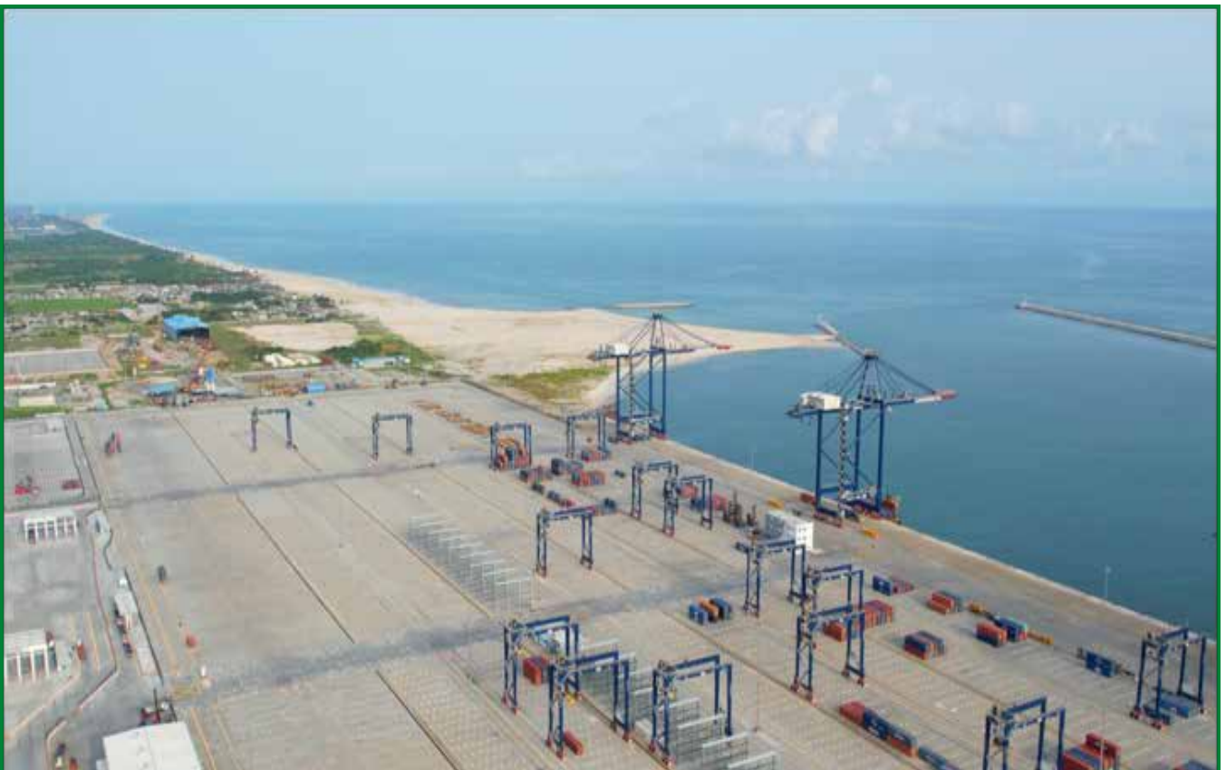
(Port en eau profonde de Lekki au Nigeria)