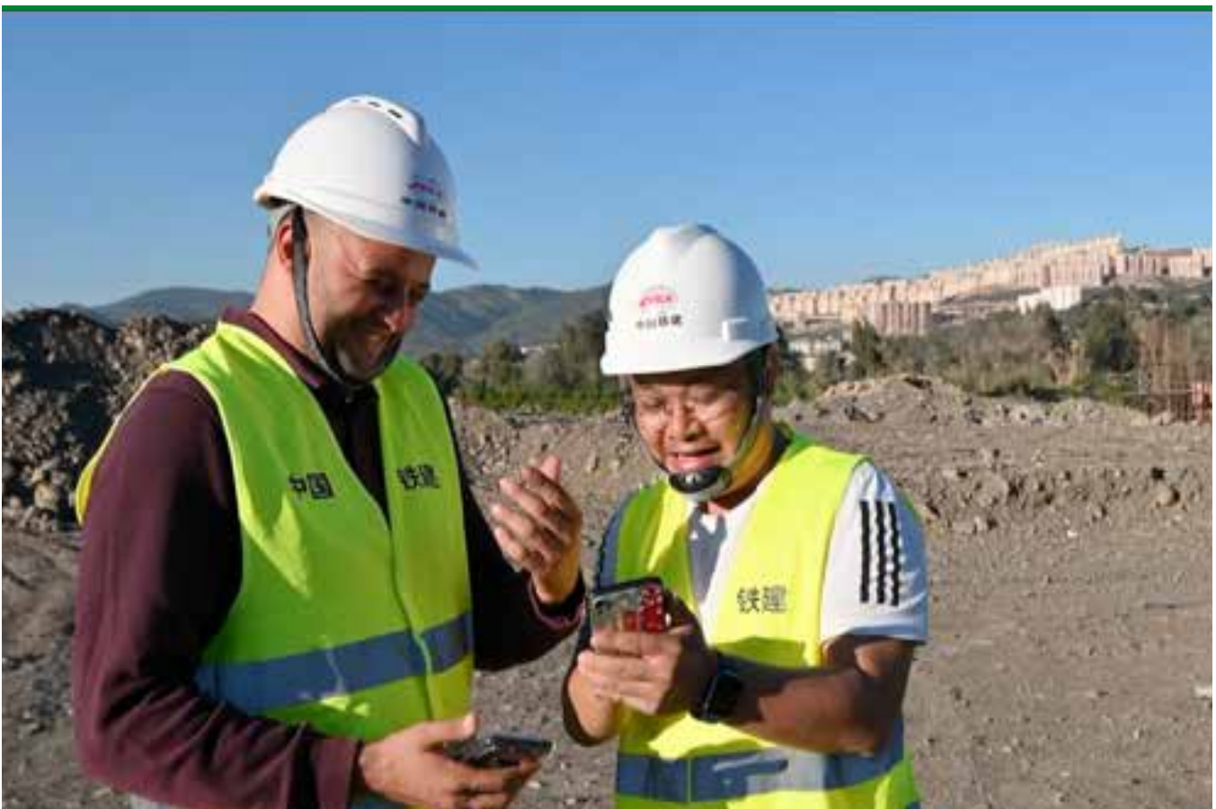
(Hilal et son collègue chinois)