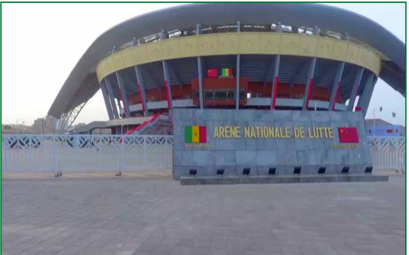
(Arène nationale de lutte du Sénégal)