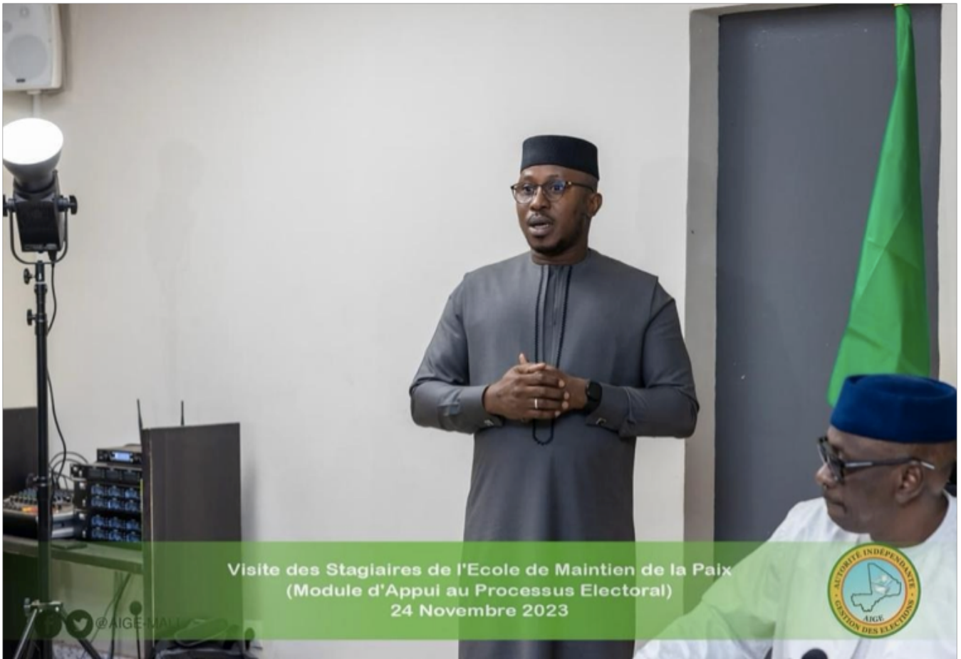
Visite des Stagiaires de l'Ecole de Maintien de la Paix (Module d'Appui au Processus Electoral) 24 Novembre 2023

avec d'autres institutions et acteurs impliqués dans le processus électoral, tels que les partis politiques, les médias et la société civile.