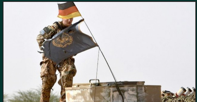
Retrait des forces étrangères du Mali : Après la MINUSMA l'Allemagne s'en va