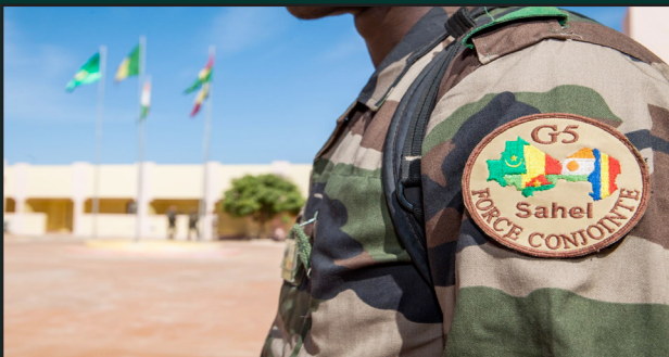
G5 Sahel : La dissolution envisagée