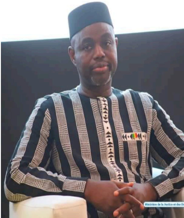
Ministère de la Justice et des Droits

Chapeau, chapeau et chapeau le travail est visible et c'est le Mali qui en bénéficie !