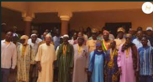
Dialogue inter-maliens : Les participants satisfaits après la phase communale