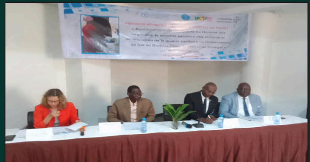
Réponse aux urgences de sécurité alimentaire : Première Réunion du Comité de Pilotage