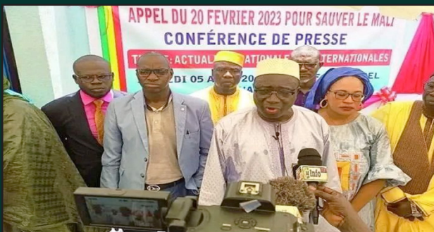
Transition L'APPEL DU 20 FEVRIER dissoute