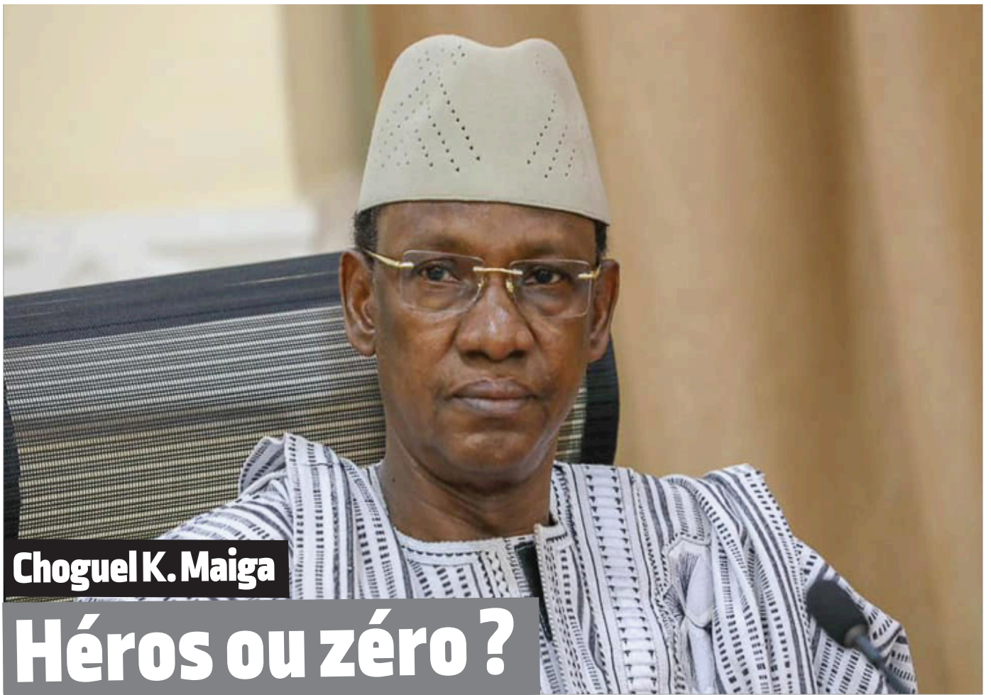
Choguel K. Maiga

QUOTIDIEN D'INFORMATION ET DE COMMUNICATION