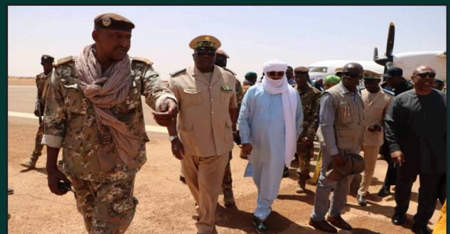
Nord du Mali Une délégation humanitaire évalue les besoins à Gao